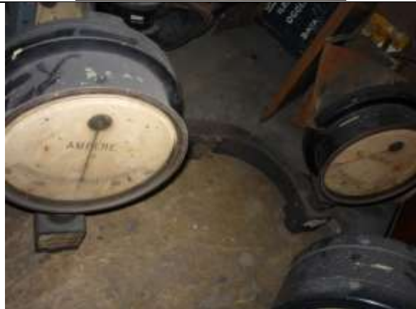
Amperomierze kontrolne Szybowskazu