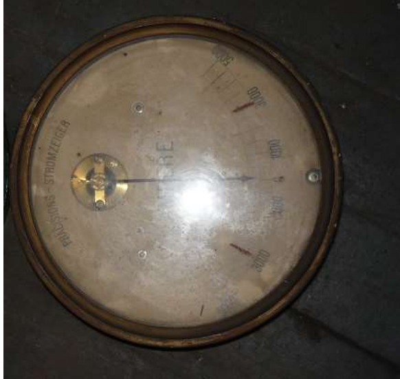
Amperomierz Siemens Halske