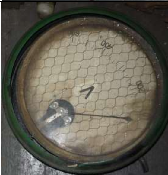
Główny wyłącznik prądu maszyny wyciągowej wraz z amperomierzem