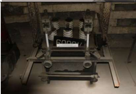
Wyłącznik mocy małoolejowy typ. SCUDM