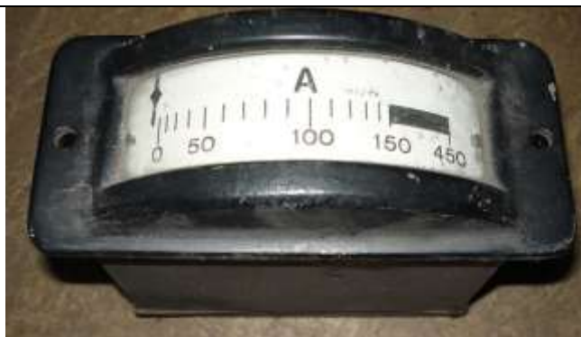
Amperomierz Siemens Halske