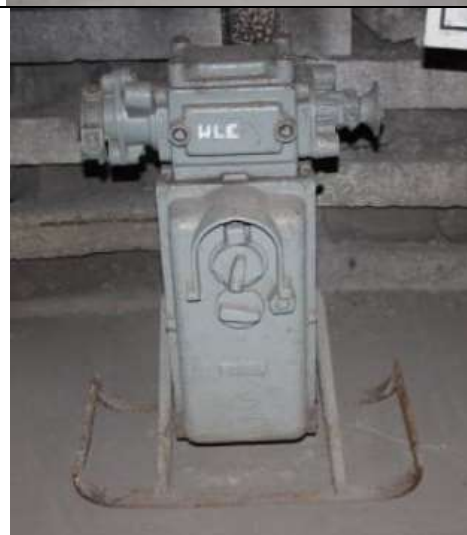
Wyłącznik mocy małoolejowy ZWAR