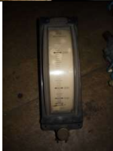
Amperomierze kontrolne Szybowskazu