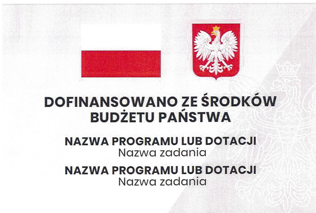
Rys. 1 Poglądowy wzór tablicy

Zgodnie z wymogami opisanymi na stronie Biuletynu Informacji Publicznej Kancelarii Prezesa Rady Ministrów pod adresem https://www.gov.pl/premier/dzialania-informacyjne .