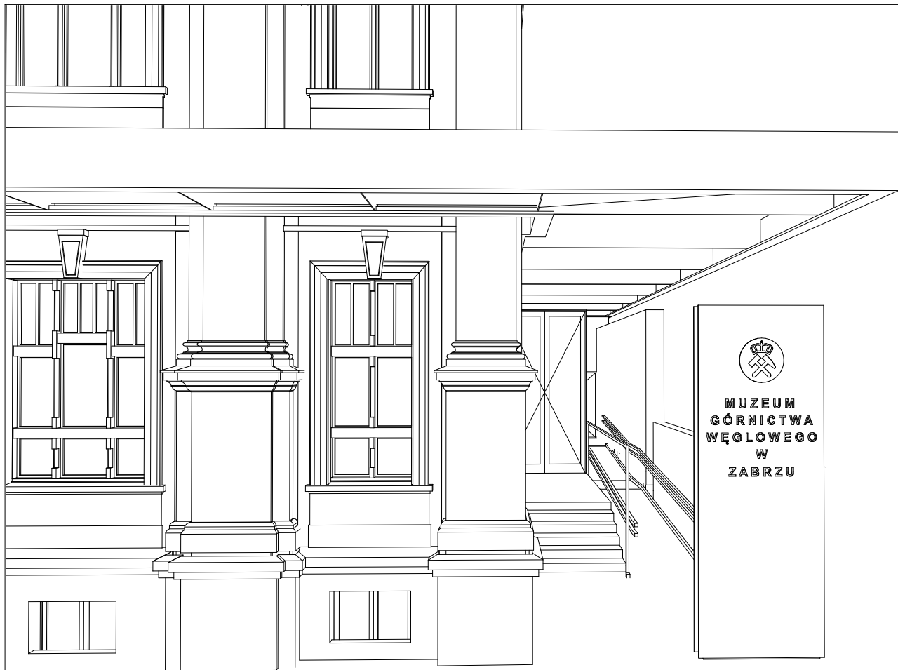
WIDOK NA WEJŚCIE DO BUDYNKU